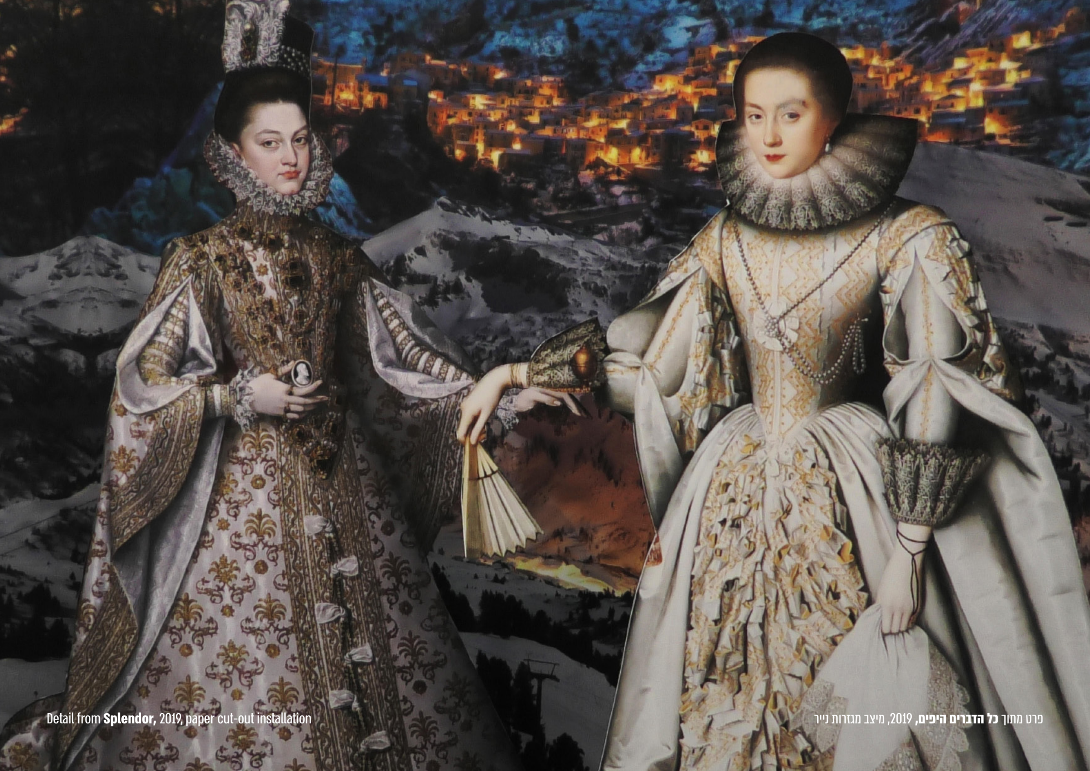
Detail from Splendor , 2019, paper cut-out installation