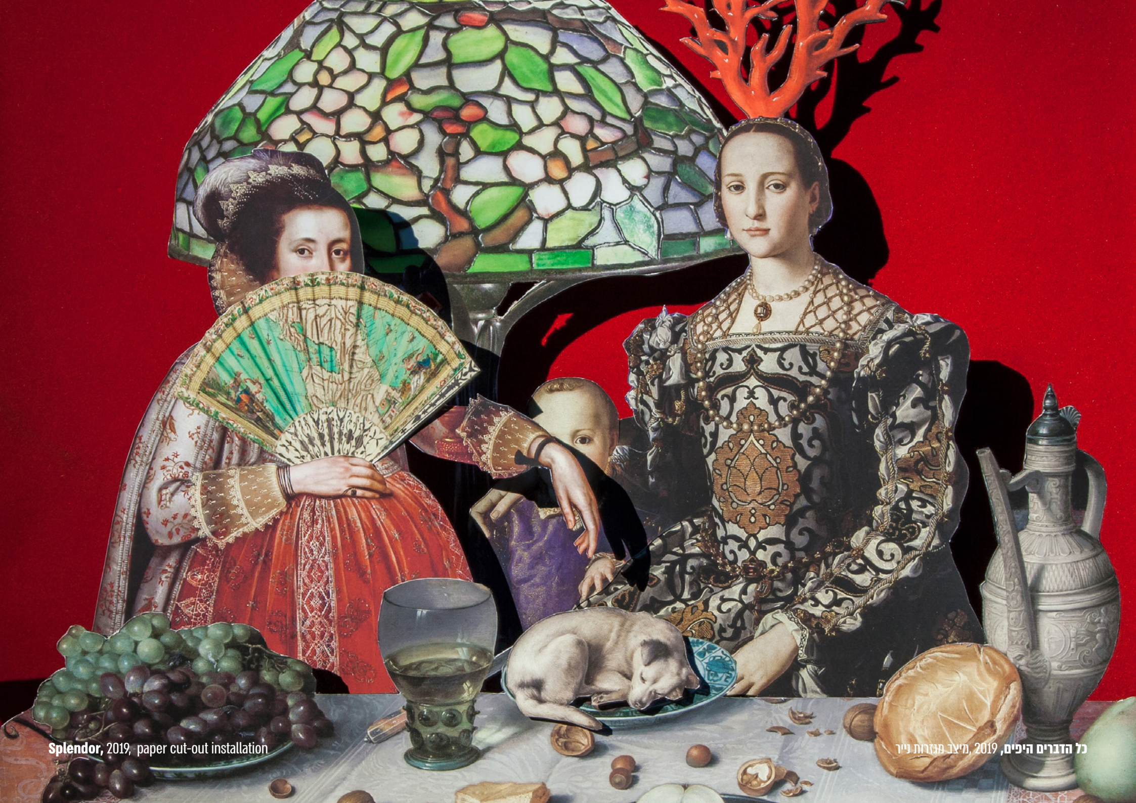
Splendor, 2019, paper cut-out installation