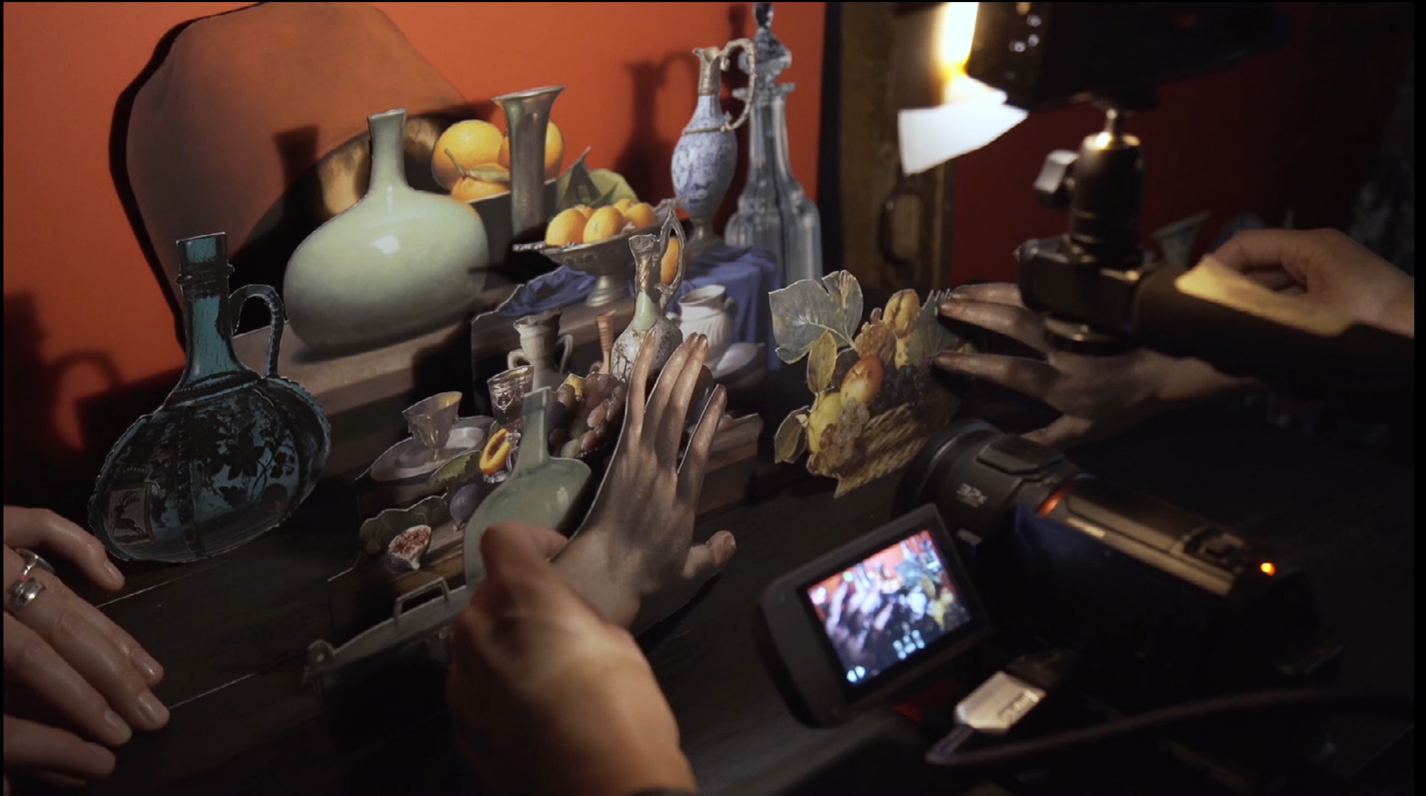
Splendor, 2019, live animation video