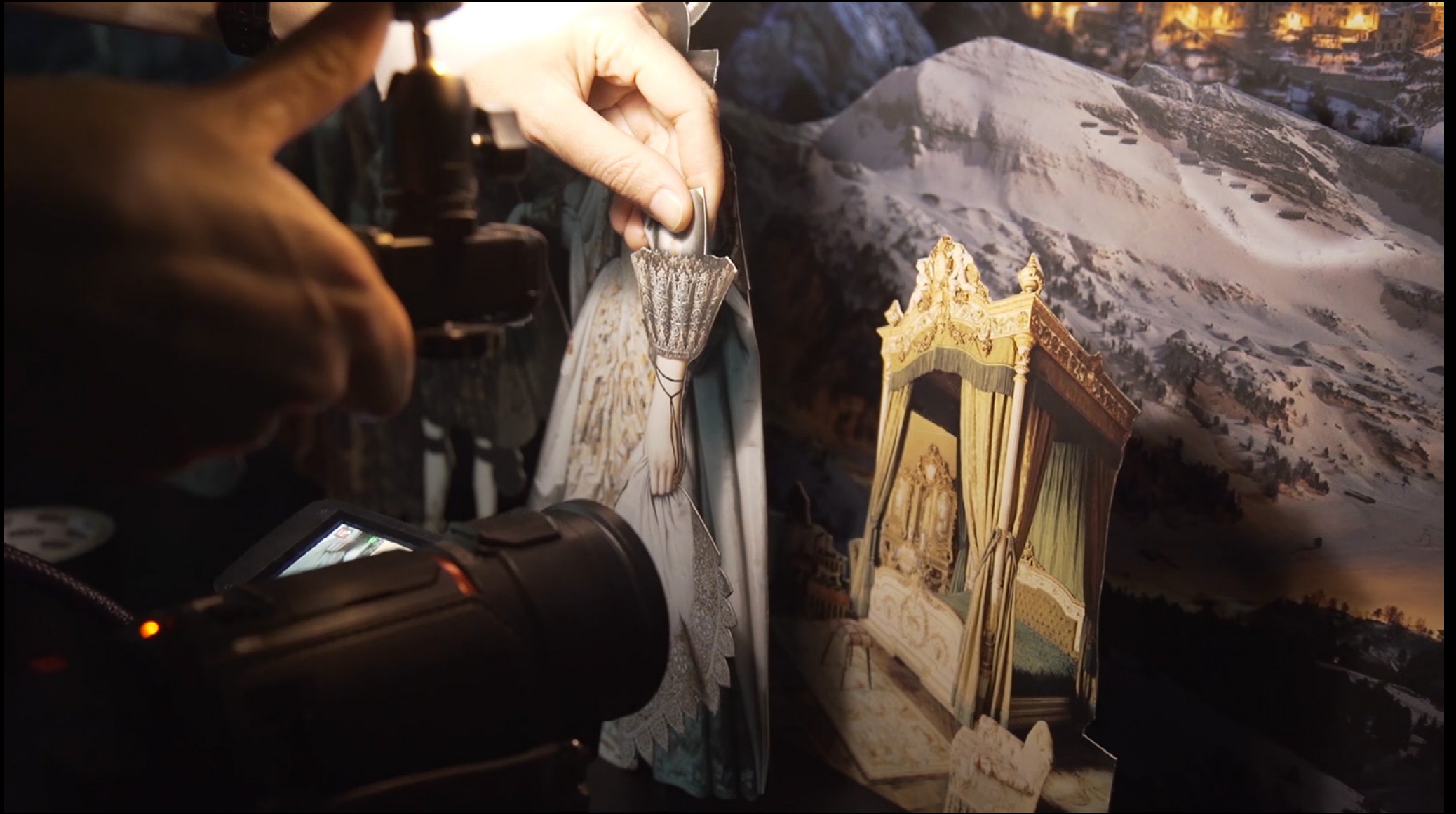
Splendor, 2019, live animation video