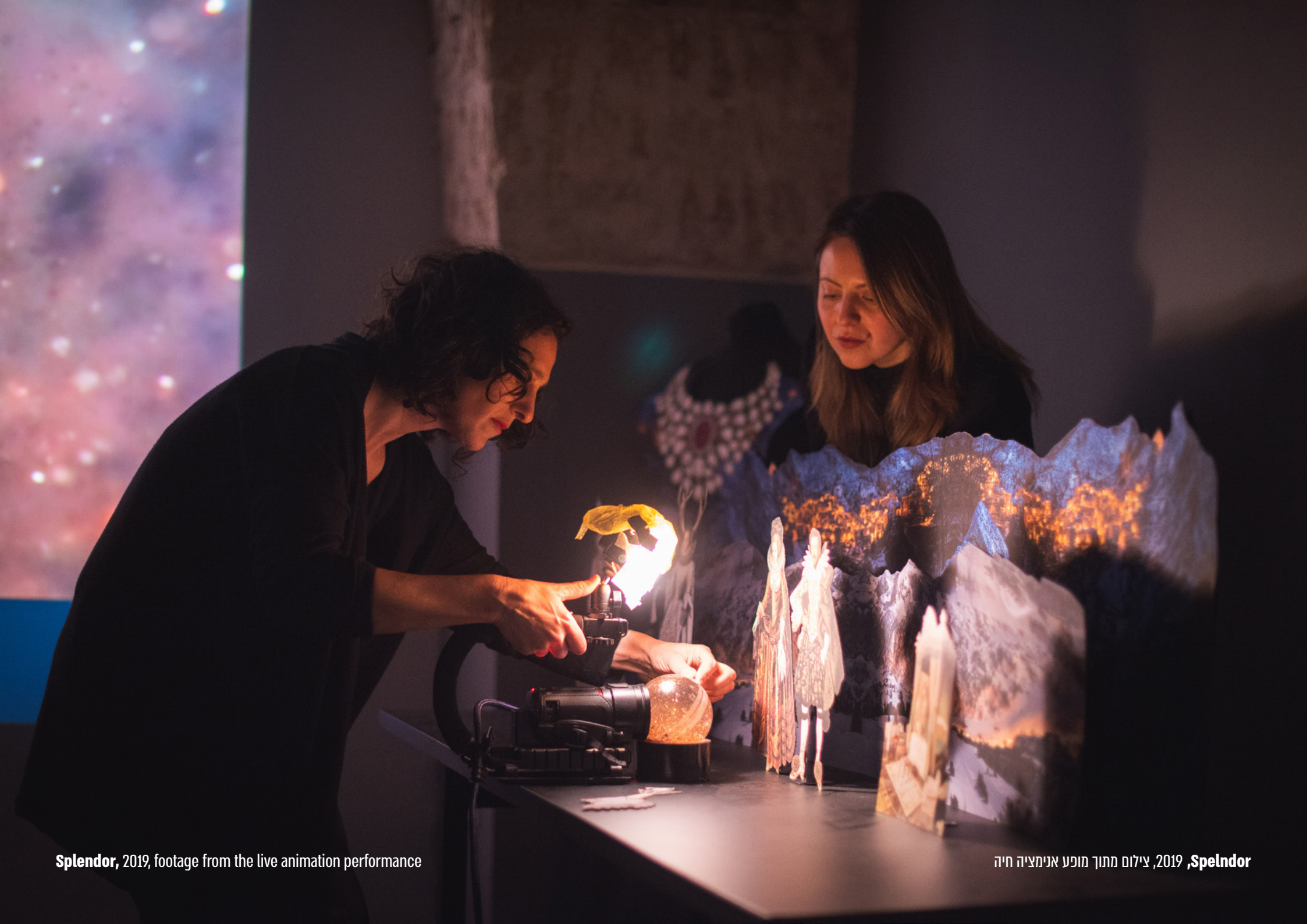
Splendor, 2019, footage from the live animation performance