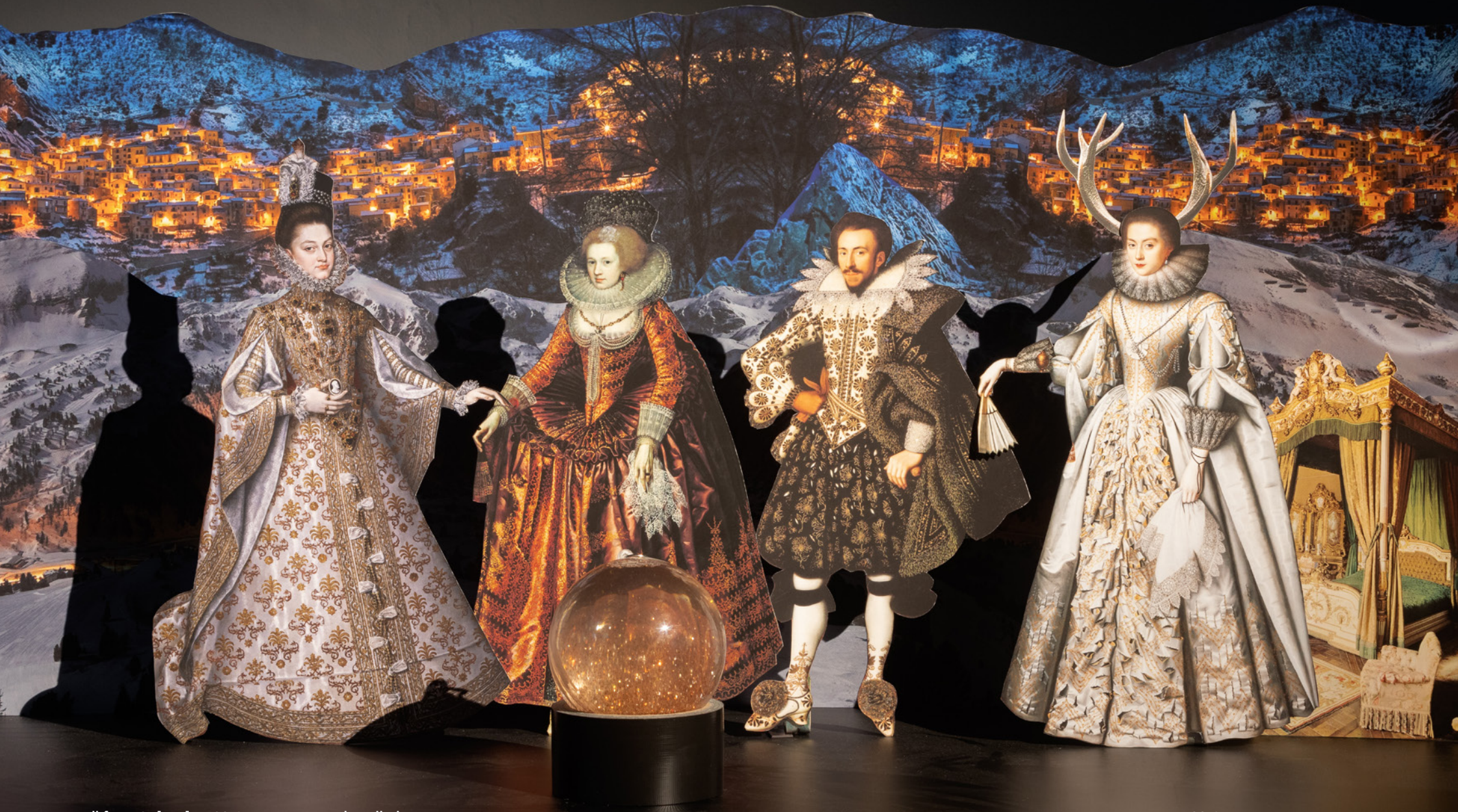
Detail from Splendor , 2019, paper cut-out installation