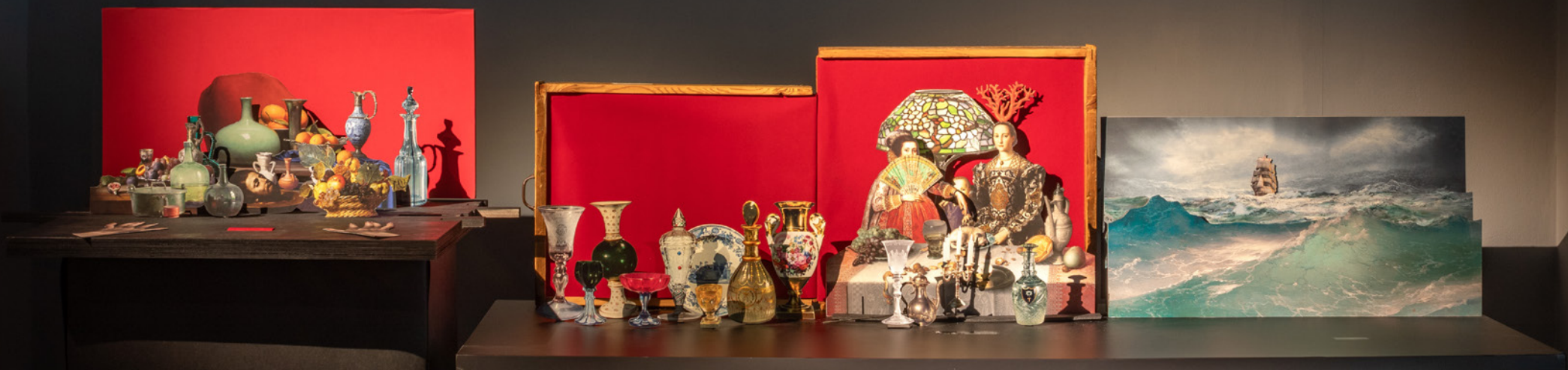
כל הדברים היפים, 2019, מיצב מאורות נייר