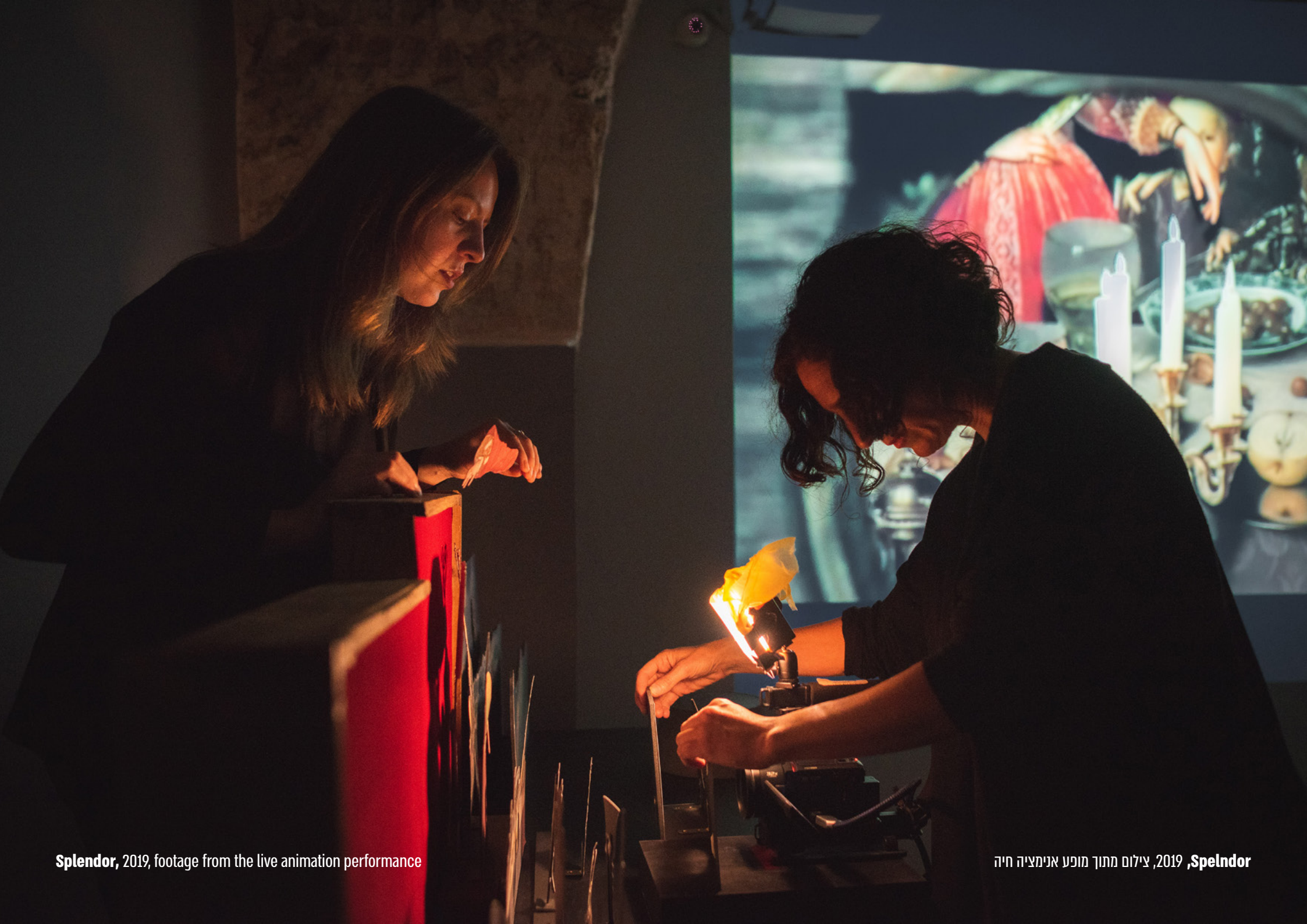
Splendor, 2019, footage from the live animation performance