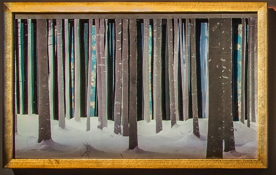
Russian Porcelain Forest, 2019, collage