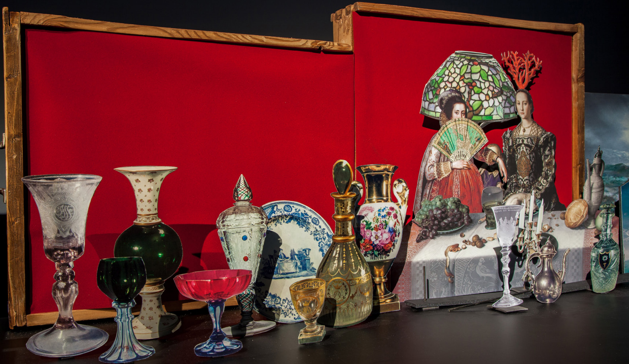
Splendor, 2019, paper cut-out installation